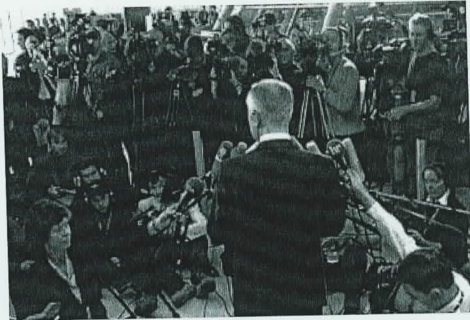
„Wie ist die Stimmung?“ Scheinbar einfache Journalisten-Fragen können so manchen Sprecher in die Enge treiben

Interviews und Talkshows sind die Duelle unter den TV-Formaten. Politiker können und wollen sie nicht meiden. Doch Achtung: Nicht immer ist der, der schnell zieht, auch erfolgreich.