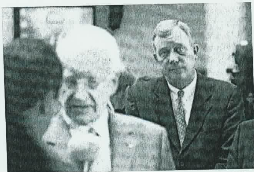
Vorne das Statement, hinten der Coach: Edmund Stoiber und Ex-Berater Michael Spreng im Wahlkampf 2002

die Welt zu setzen. Es sollte der Persönlichkeit und dem Stil des Sprechers angemessen sein, denn immerhin muss es von ihm – und im Erfolgsfall von den Medien – etliche Male wiederholt werden. Was zum Sprecher passt, bleibt länger glaubhaft und macht es ihm leichter, den Begriff phantasievoll und variantenreich in verschiedenen Zusammenhängen auszuschnürceln und zu platzieren. Ein „getesteter“ Begriff ist darüber hinaus stabiler gegen Missverständnisse und Irritationen in den eigenen Reihen. Da wirkungsvolle Schlagworte immer auch emotionalisieren, lohnt sich vorab eine Untersuchung der internen Risiken und Nebenwirkungen. Einen festen Partner, und sei es „nur“ ein Wort, wähle man mit Feingefühl.